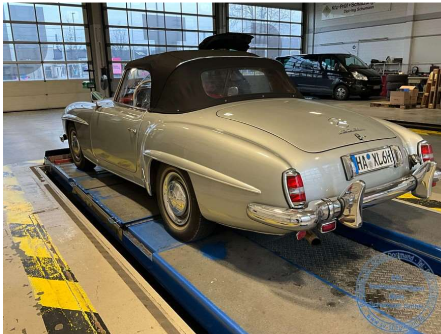
Ansicht hinten links