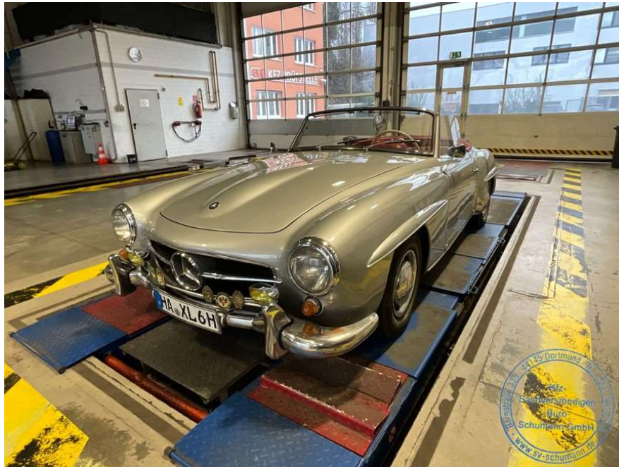
Ansicht vorne links