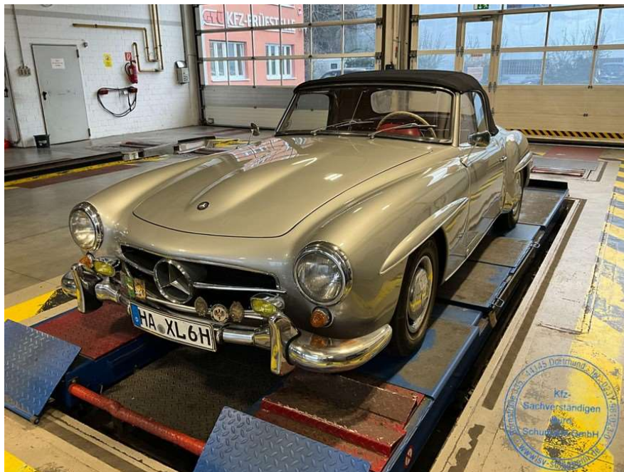
Ansicht vorne links