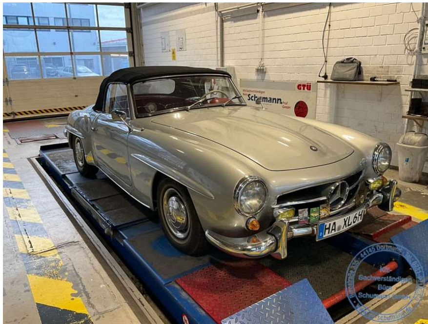
Ansicht vorne rechts