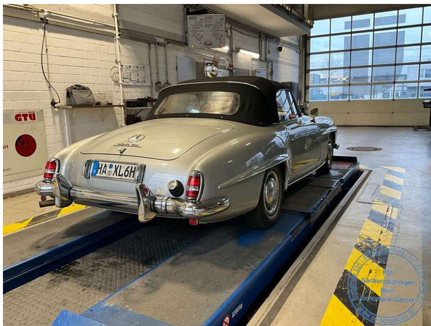
Ansicht hinten rechts