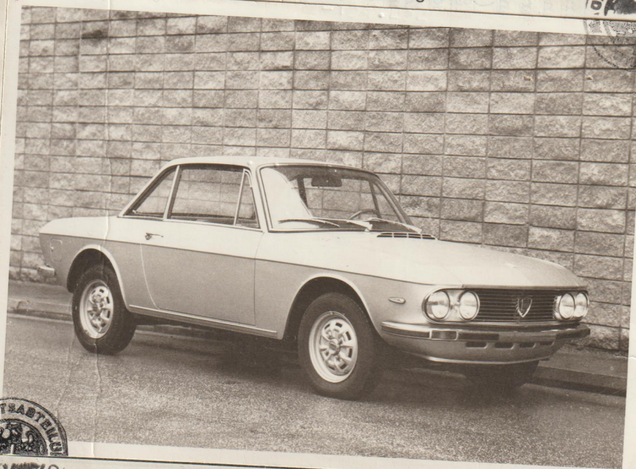
Lichtbild des Fahrzeuges

Auf Grund eines Ansuchens wird gemäß § 31 Abs. 2 KFG. 1967, BGBl. 267/1967, das nachfolgend dargestellte Fahrzeug genehmigt.