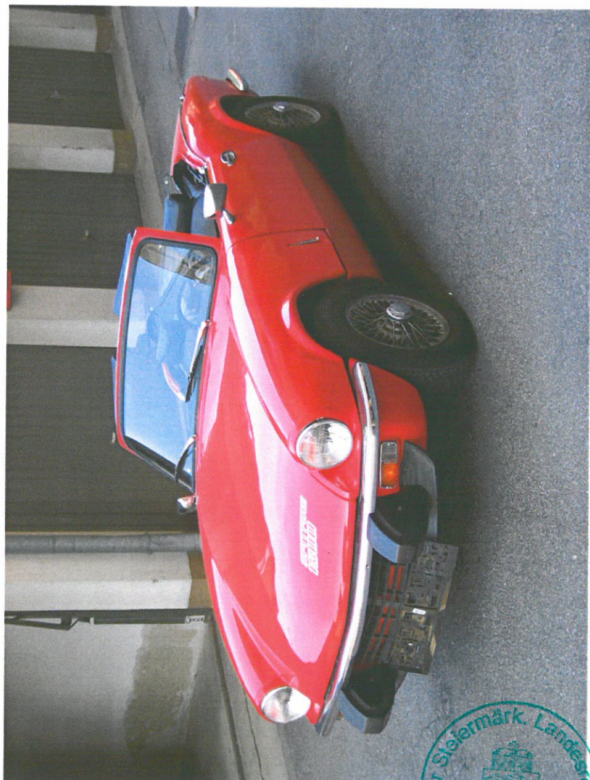
Lichtbild des Fahrzeuges